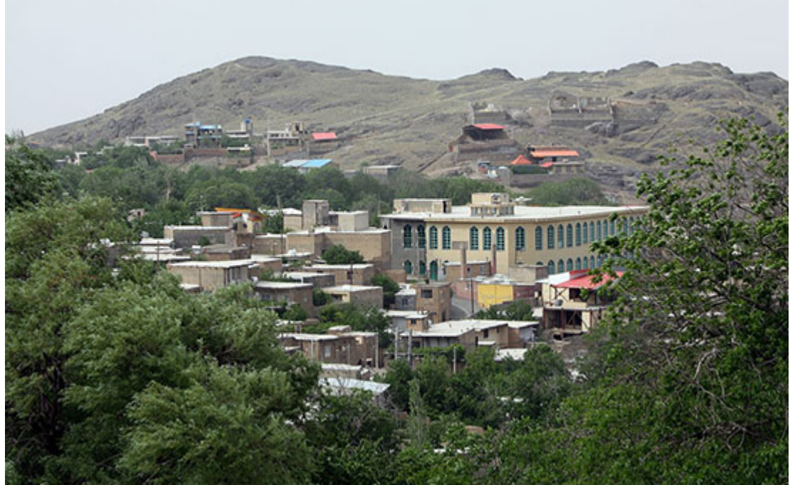
روستاهای تاریخی : ابیانه؛ یاقوت سرخ ایران

----- ----- ----- ----- ----- ----- ----- ----- ----- -----